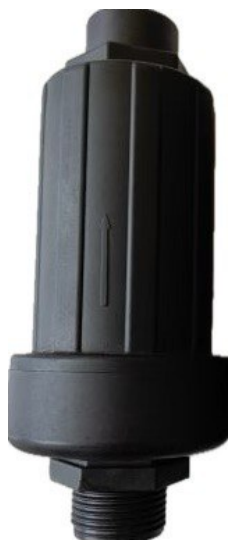
Клапан с подключением 1"НР

Присоединительный размер: 1" /1,5" НР Максимальное давление: 10,5 атм. Материал: пластик