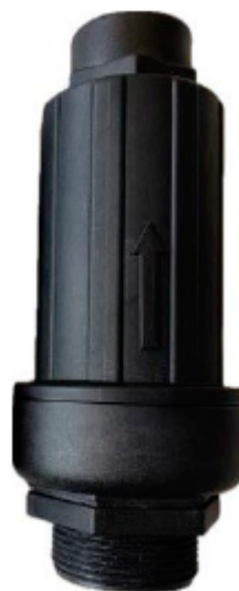
Клапан с подключением 1,5"НР